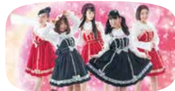
愛の葉ガールズ(農業ガールズ)

2012年12月3日にデビューした愛媛県松山市を拠点に活動する日本のアイドルグループ。日本の美味しい「食」、日本の安全な「食」を推進する『農業アイドル』。実際に自分たちの農園をホームグラウンドにして農業の魅力を感じ、「農家後継者不足」の解消に努めている。