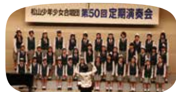
松山少年少女合唱団

「松山少年合唱団」として、昭和39年(1964年)5月、小学4年～6年の男子だけの合唱団として設立。昭和56年(1981年)に小学5年～6年の少女を加え、「松山少年少女合唱団」と団名を変える。「MBGC」の名で表すこともあるがそれは、「Matsuyama Boys & Girls Chorus」の頭文字をとっている。